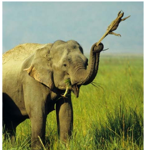
Էրեջը և Էդոյը բնական միջավայրում