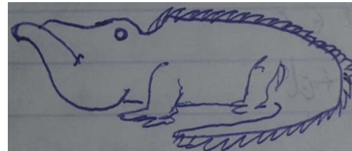
Էրեջ Ա Իմաստուն, պատկերված խլեզի տեսքով, ինչպես Նրան նկարագրում էր Կուրդիսյան Բիլորը, Ֆիզմաթ հատուկ դեբիլների դպրոց 2